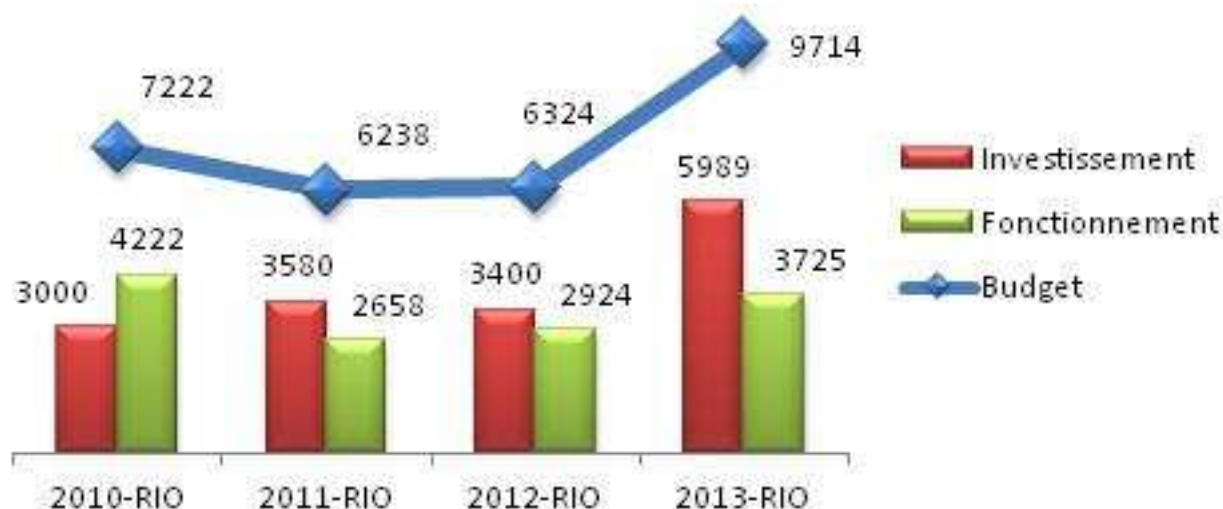
Graphique : Evolution (en millions) du budget du MINPMEESA entre 2010 et 2013